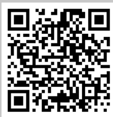
Скануй QR-код, щоб дізнатись більше про ремонт